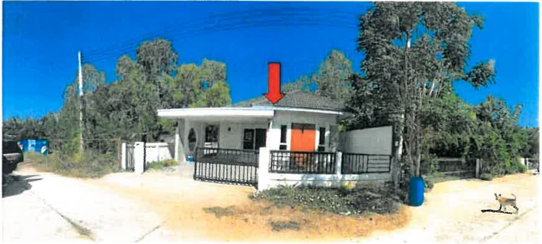
สภาพทั่วไปบริเวณด้านหน้าทรัพย์สิน / บ้านเดี่ยวชั้นเดียว เลขที่ 536 หมู่ที่ 11 (จุดถ่ายภาพที่ 7)