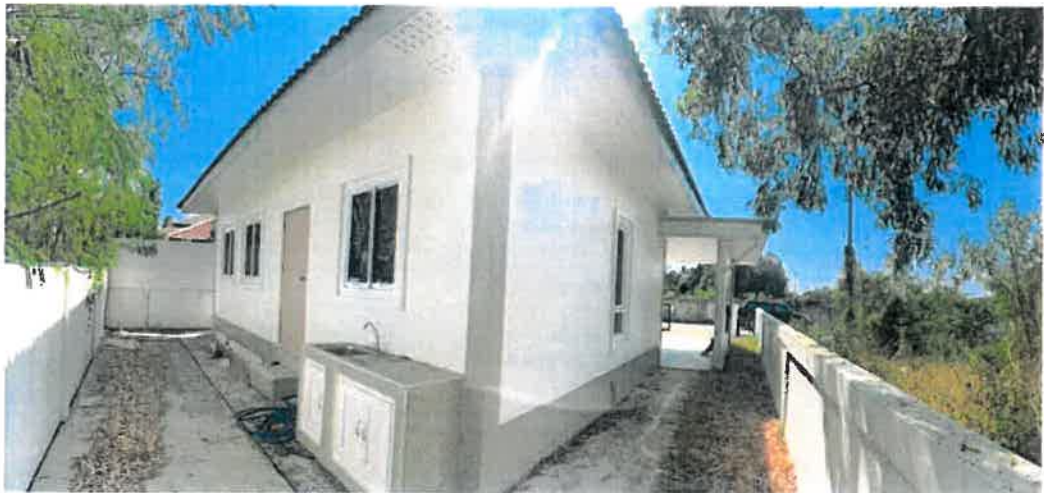
สภาพทั่วไปบริเวณภายในทรัพย์สิน (จุดถ่ายภาพที่ 8)