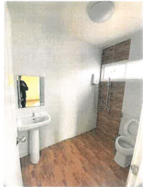
สภาพภายในอาคาร / ห้องนอน ห้องครัว และห้องน้ำ