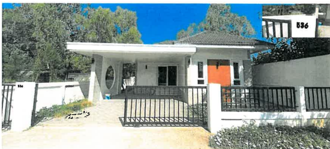
สภาพบ้านเดี่ยวชั้นเดียว จำนวน 1 หลัง เลขที่ 536 หมู่ที่ 11