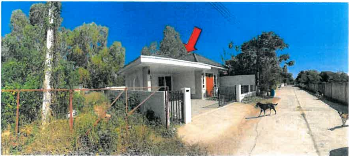
ถนนภายในหมู่บ้านเสริมวันวิลล์ ผ่านหน้าที่ตั้งทรัพย์สิน (จุดถ่ายภาพที่ 6)