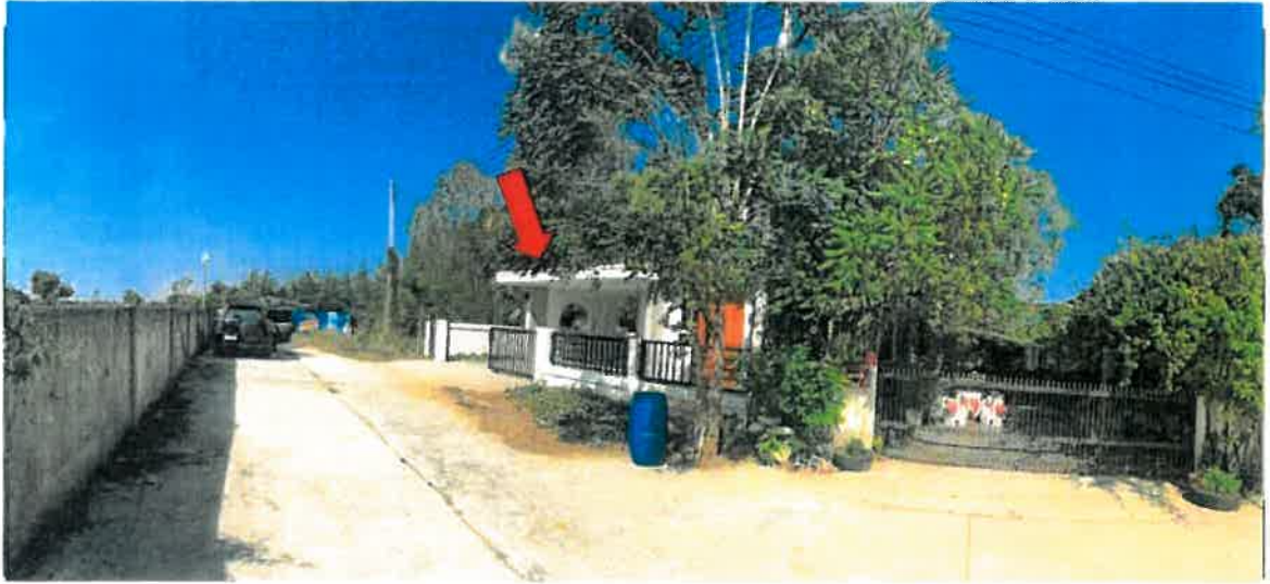
ถนนภายในหมู่บ้านเสริมวันวิลล์ ผ่านหน้าที่ตั้งทรัพย์สิน (จุดถ่ายภาพที่ 5)