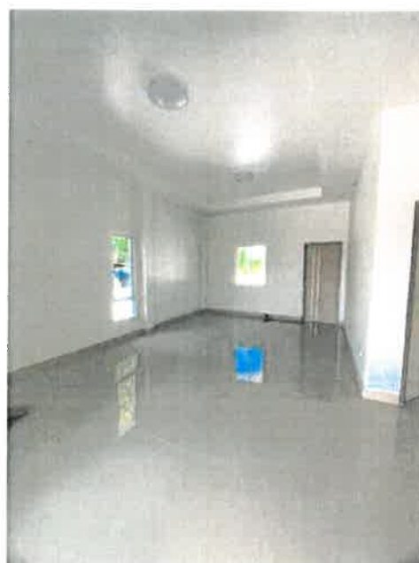
สภาพภายในอาคาร / ที่จอดรถ , ห้องโถงรับแขก