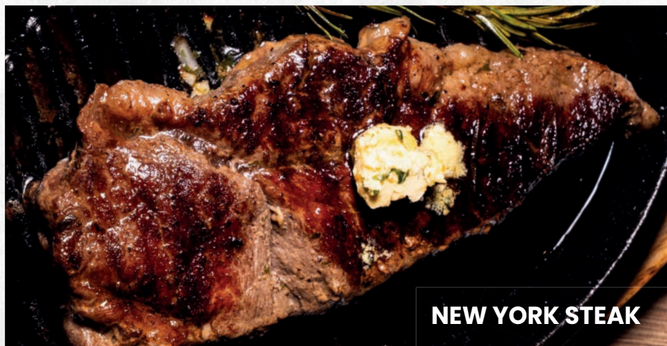
NEW YORK STEAK